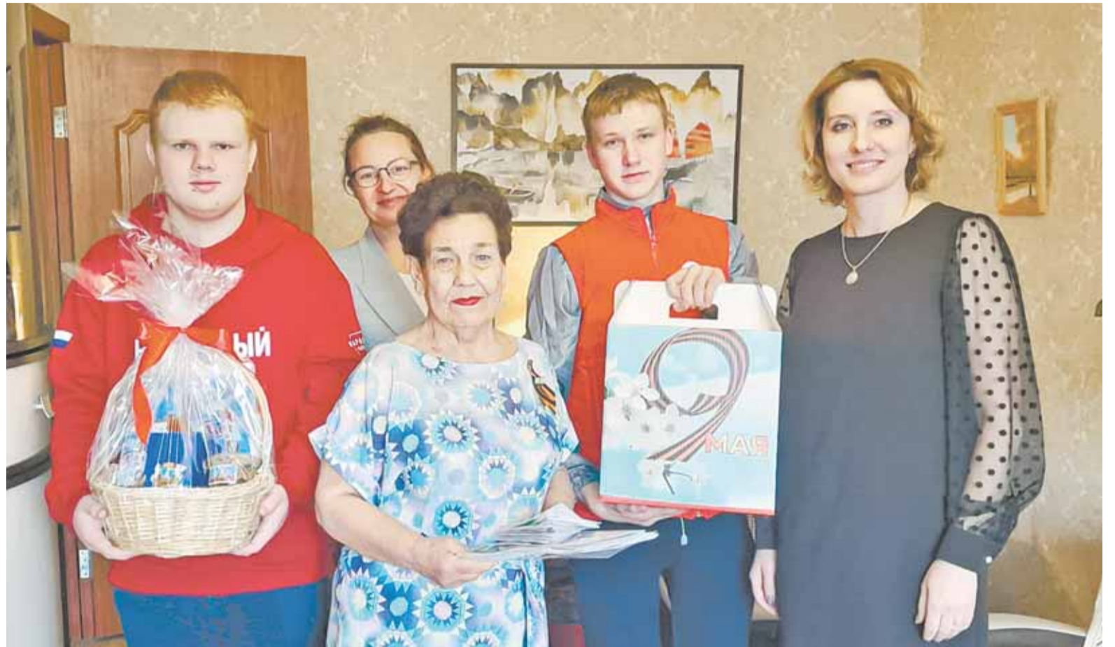
Специалисты УСЗН г. Барнаула не оставляют без внимания ветеранов.

— До этой должности она долгое время работала в управлении, постепенно росла как профессионал, начиная с должности юрисконсульта управления Ленинского района. Ее готовили в резерв на