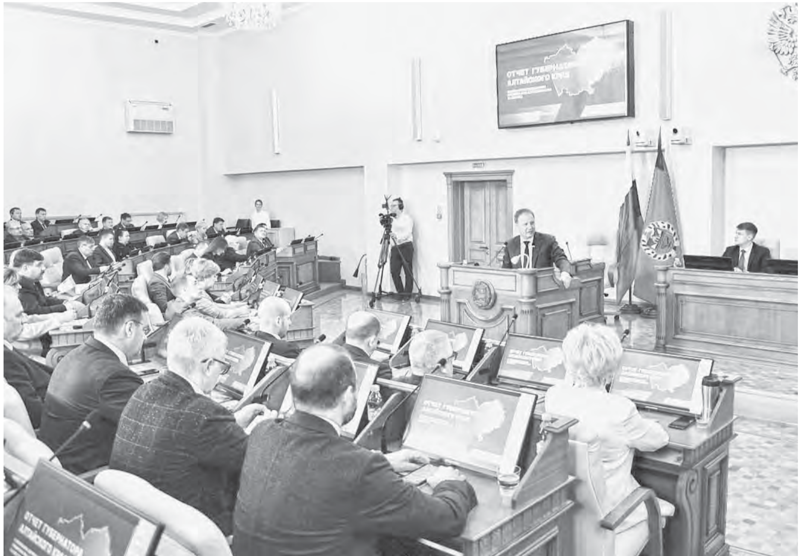
Практически по всем показателям социально-экономического развития Алтайский край демонстрирует положительную динамику.

Виктор Томенко подробно отметил, что в 2023 году в Алтайском крае обеспечено устойчивое развитие экономики и социальной сферы региона. Объем финансирования в сфере социальной защиты превысил 59 миллиардов рублей (рост на 35,8%). Продолжена работа по повышению доступности и качества первичной медико-санитарной помощи, развитию современной инфраструктуры образовательных организаций, повышению доступности и качества услуг