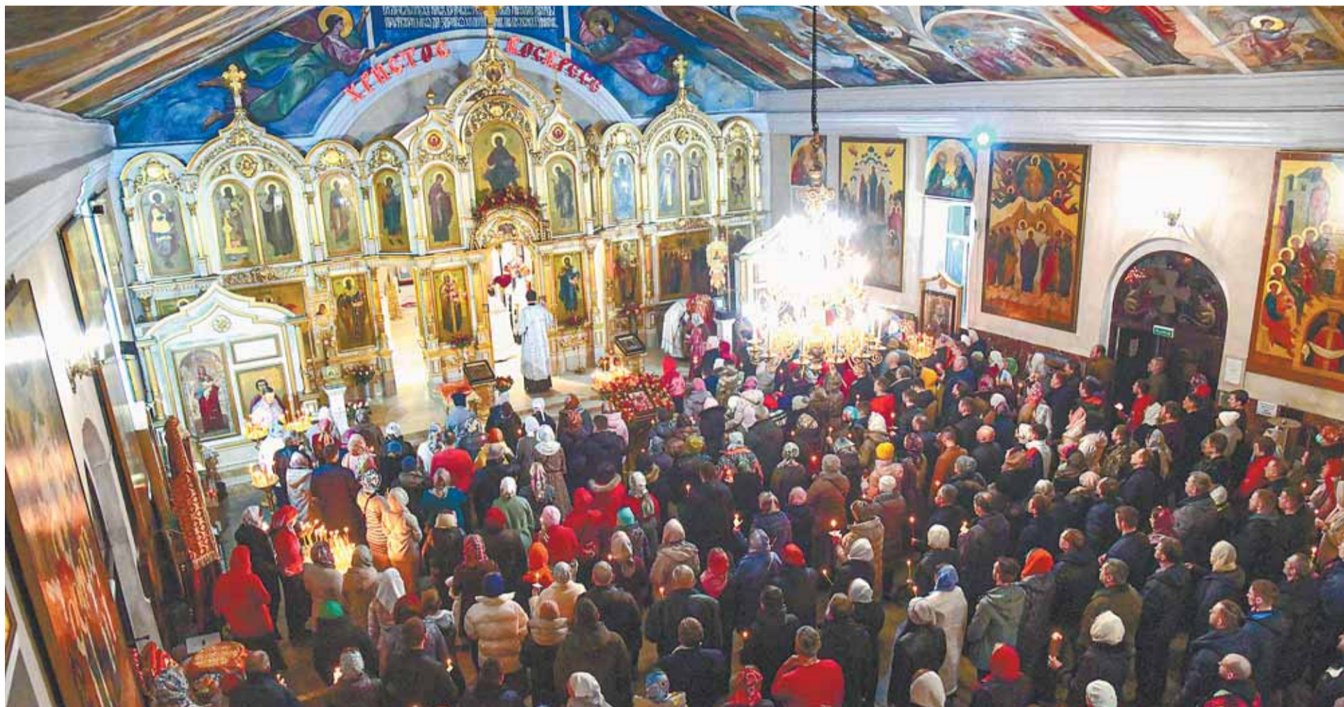
Пасха — один из главных праздников для православных христиан.