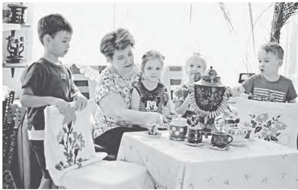
Все экспонаты музея можно трогать руками.