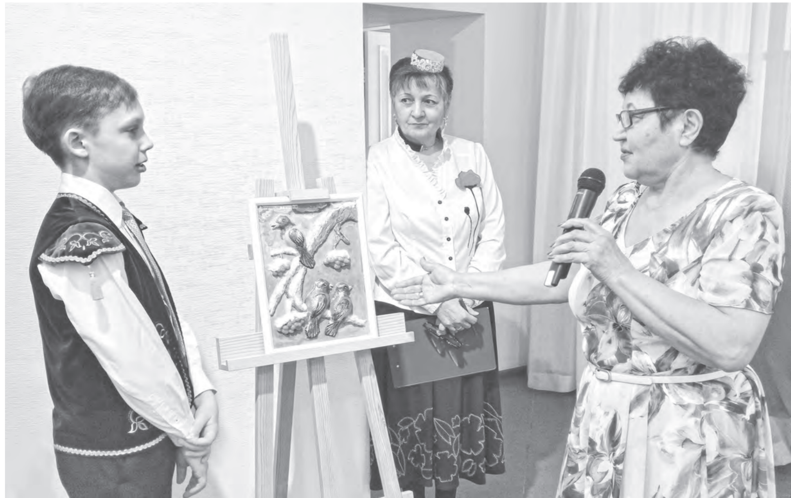
Воспитанники творческого кружка создают объемные картины из соленого теста.

Среди витрин с вылепленными фигурками расположены и настоящие картины. На одной из них – журавли, озеро, ромашковая поляна, на другой – пейзаж с горами, березами и закатом. И стволы, и волны горной реки,