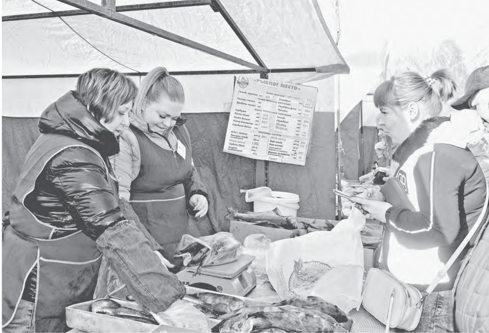
У продавцов рыбных рядов недостатка в покупателях не было.

– У нас самая большая ярмарочная площадка. Барнаульцы ее знают, многие приезжают из других районов города, говорят, что здесь выбор больше, шире ассортимент. Ярмарка официально начинается с 10 утра, а фактически чуть ли не с рассветом. Я приехала в шесть часов, за мясом уже очереди стояли. У нас мясо стоит дешевле, чем на рынке