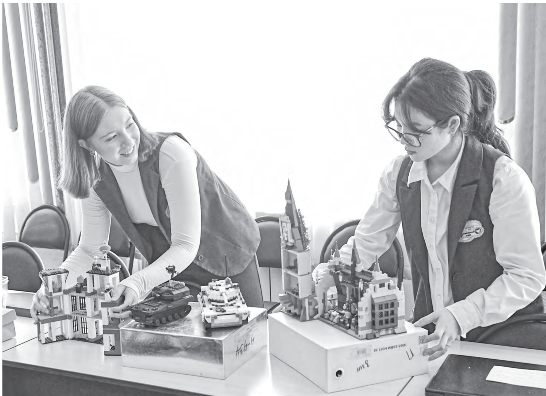
Свои разработки учащиеся школы № 53 презентовали на трех разных площадках.