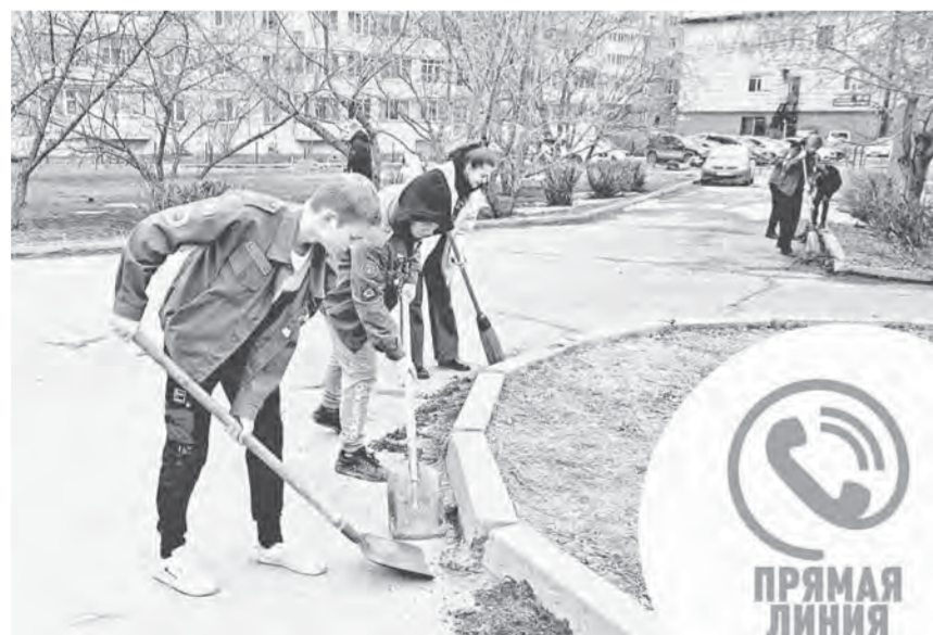
Молодежь Барнаула активно участвует в экологических акциях и «чистых четвергах».