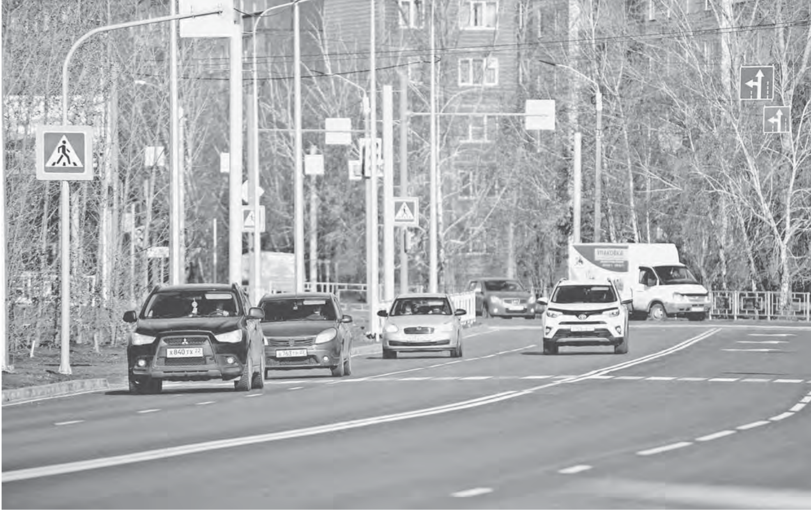
Изменения в законе о безопасности дорожного движения направлены на снижение аварийности.

Сколько именно водителей с иностранными правами ездит