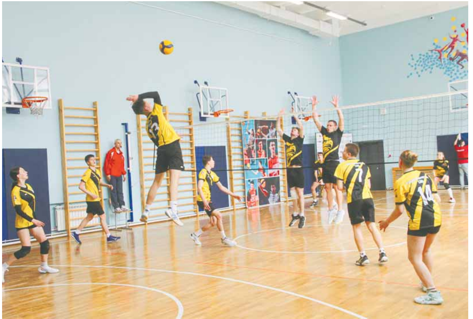
В финальной игре барнаульцам помогли победить преимущество в мастерстве и росте.

Но это план на будущее. В нынешнем же сезоне восемь лучших команд по итогам предварительных игр на зональных этапах вышли в финал. Кстати, критерий отбора нынче поменяли. Раньше участники организаторам высказывали претензии: мол, независимо от количества участников на отборочной стадии дальше проходят две команды. Проще говоря, в Индустриальном районе Барнаула за путевку в городской финал борются 20 команд, в Центральном – пять. Конкуренцию не сравнить, но проходят что там, что там – по две. Сейчас же систему изменили. Шесть команд в отборе – дальше идет одна. До