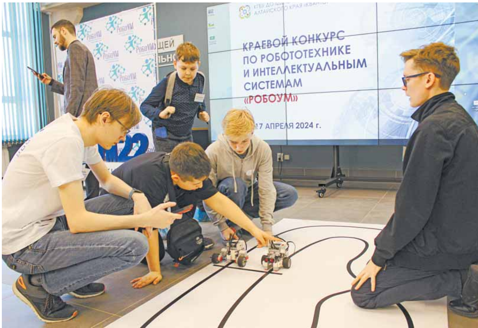
В гонках роботов на колесах участвуют ребята средней возрастной категории.