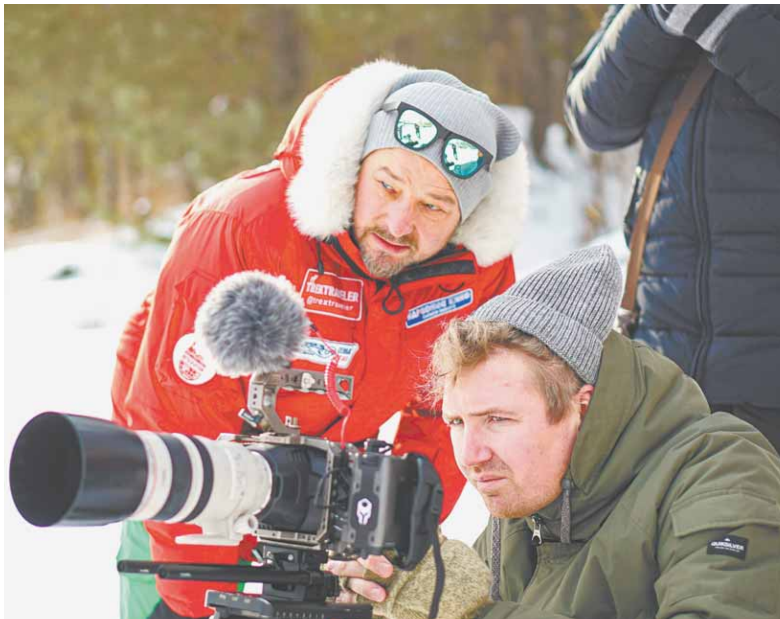
В течение пяти съемочных дней природа Алтая во всем благоволила кинопроцессу.