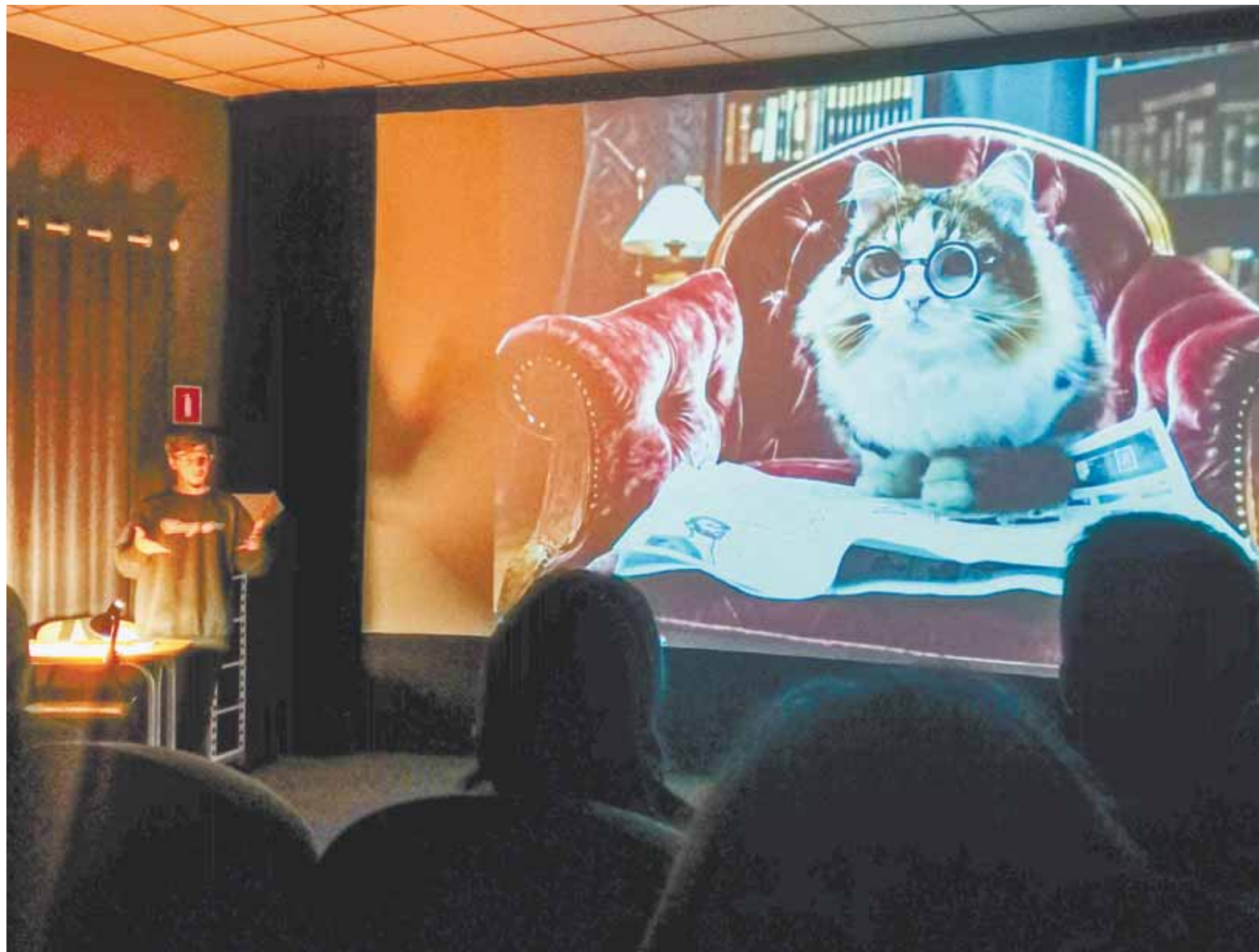
В кинозале «Премьера» показали короткие видеоролики, созданные искусственным интеллектом.

В киноиндустрии нейросети используются более хитрыми способами. Участникам мастер-класса показали не только готовые проекты, но и их бэкстейдж. И если по итоговому видео в принципе непонятно, как оно делалось, то пошаговый разбор работы над ним показывает: вот съемки в павильоне, вот съемки у зеленого экрана, вот вместо «зеленки» накладывается видео морских волн – на этом этапе нейросети еще не задействованы. Они помогают преобразовать видеоряд в определенную стилистику, добавить эффект нарисованности, ведь действие происходит внутри картины. А подражание разным художественным