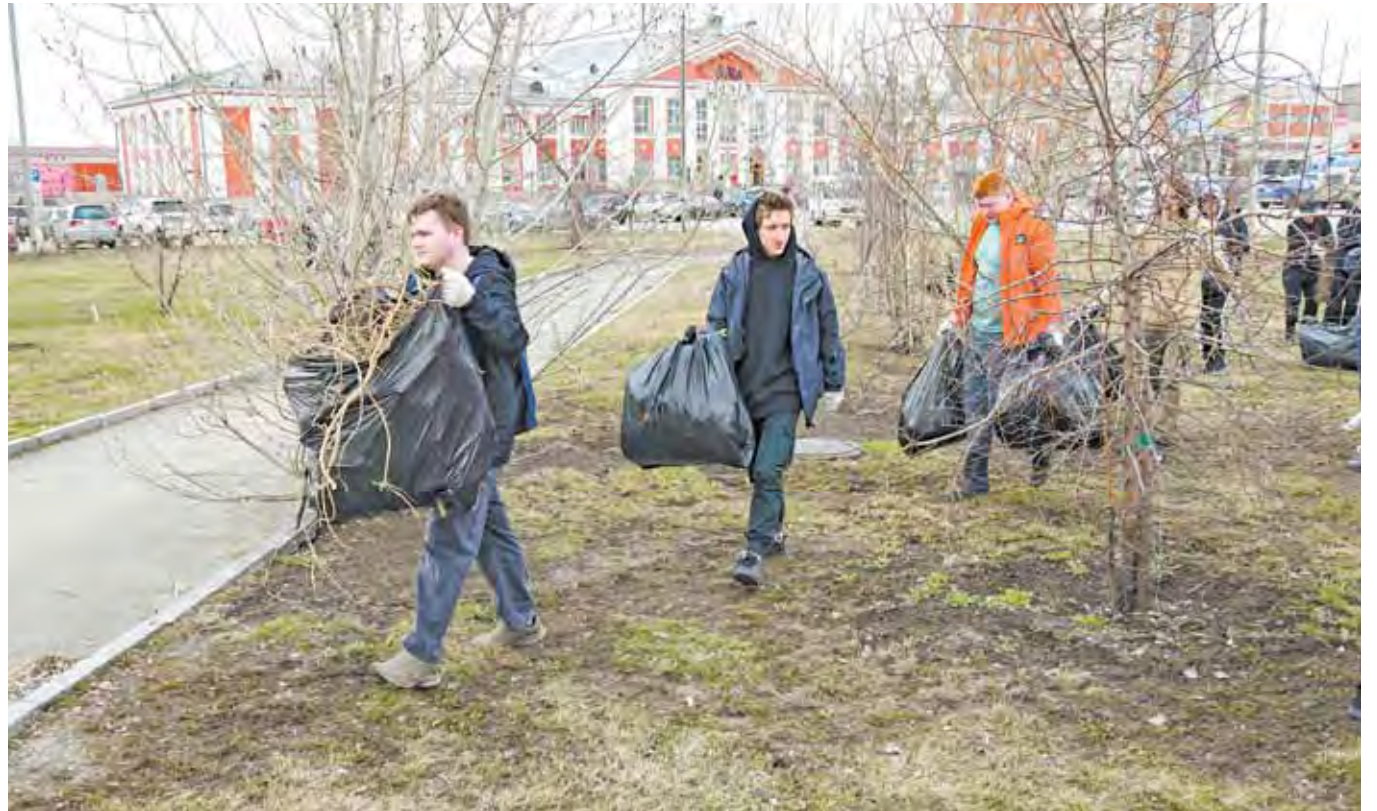
Студенты Алтайского госколледжа привели в порядок сквер напротив Железнодорожного вокзала.