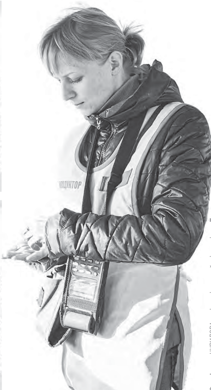
Фото Андрей ЧУРИЛОВА, инфографика с сайта barناول.org