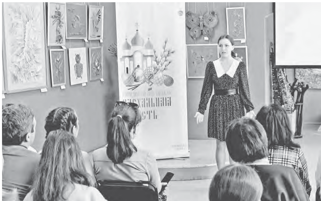
Каждый участник был по-своему уникален и интересен.