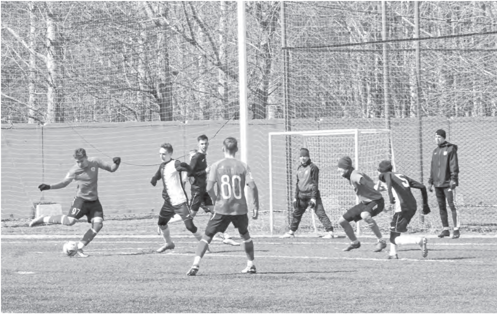
Проверка сил перед сезоном получилась интересной.