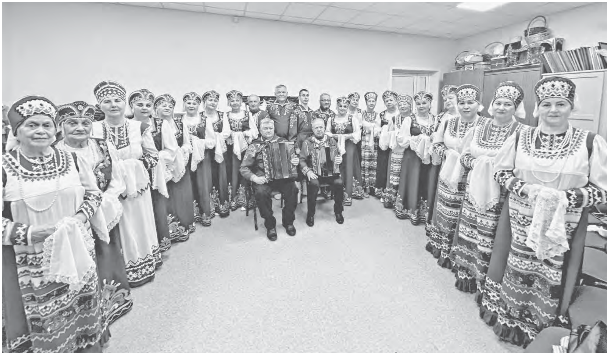
Народный хор ветеранов «Ивушка» – частый гость на разных концертных площадках.