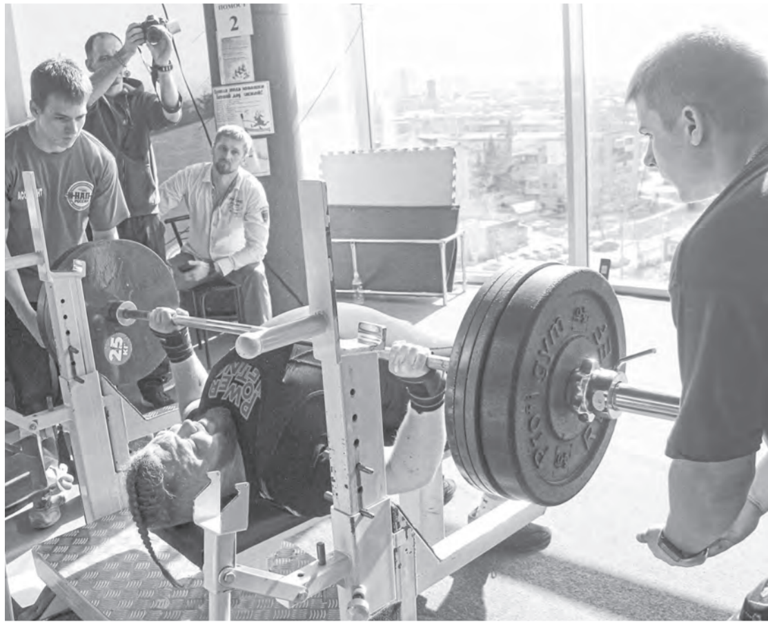
Штангу можно покорить в любом возрасте.

Силачи из нескольких регионов соревновались в Барнауле