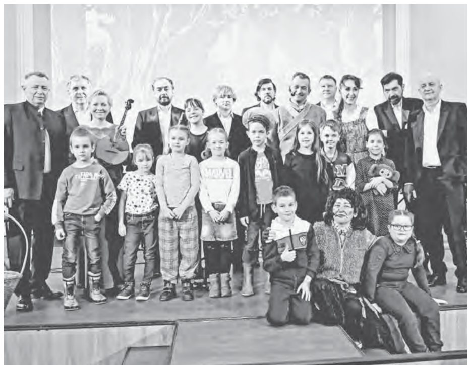
После концерта юные зрители долго не расходились, общались с музыкантами.