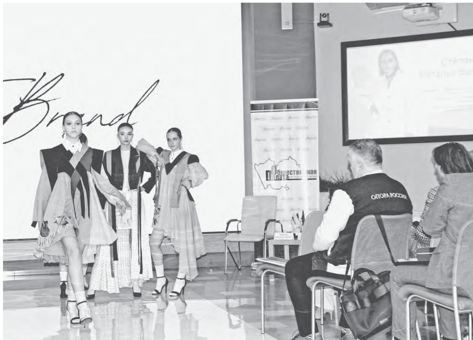
Модную индустрию на заседании представила Академия моды и стиля New Style.

— Это должно быть единый объект с мастерскими и выставочными залами, который станет точкой притяжения и позволит