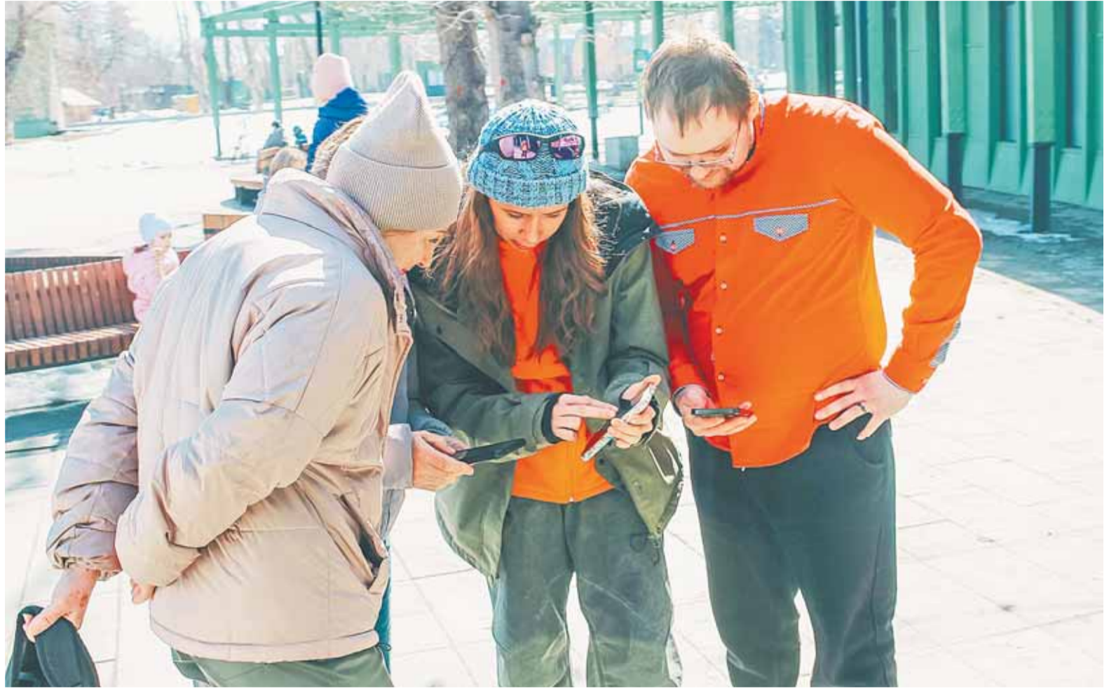
Если пропал человек, то нужно позвонить по номеру 112, а также на горячую линию «ЛизаАлерт» 8-800-700-54-52.

– Существуют две основные причины пропажи людей в такой местности. Первая – дезориентация, человек не смог найти дорогу обратно, заблудился, а вторая – несчастный случай, например, стало плохо со здоровьем, – объясняет инструктор. – У нас есть ленточный бор, это достаточно простой лес с дальним видом обзора, в нем много просек, мало подлеска. Если идти перпендикулярно ему в одном направлении, то в любом случае можно выйти на дорогу или к домам. По-