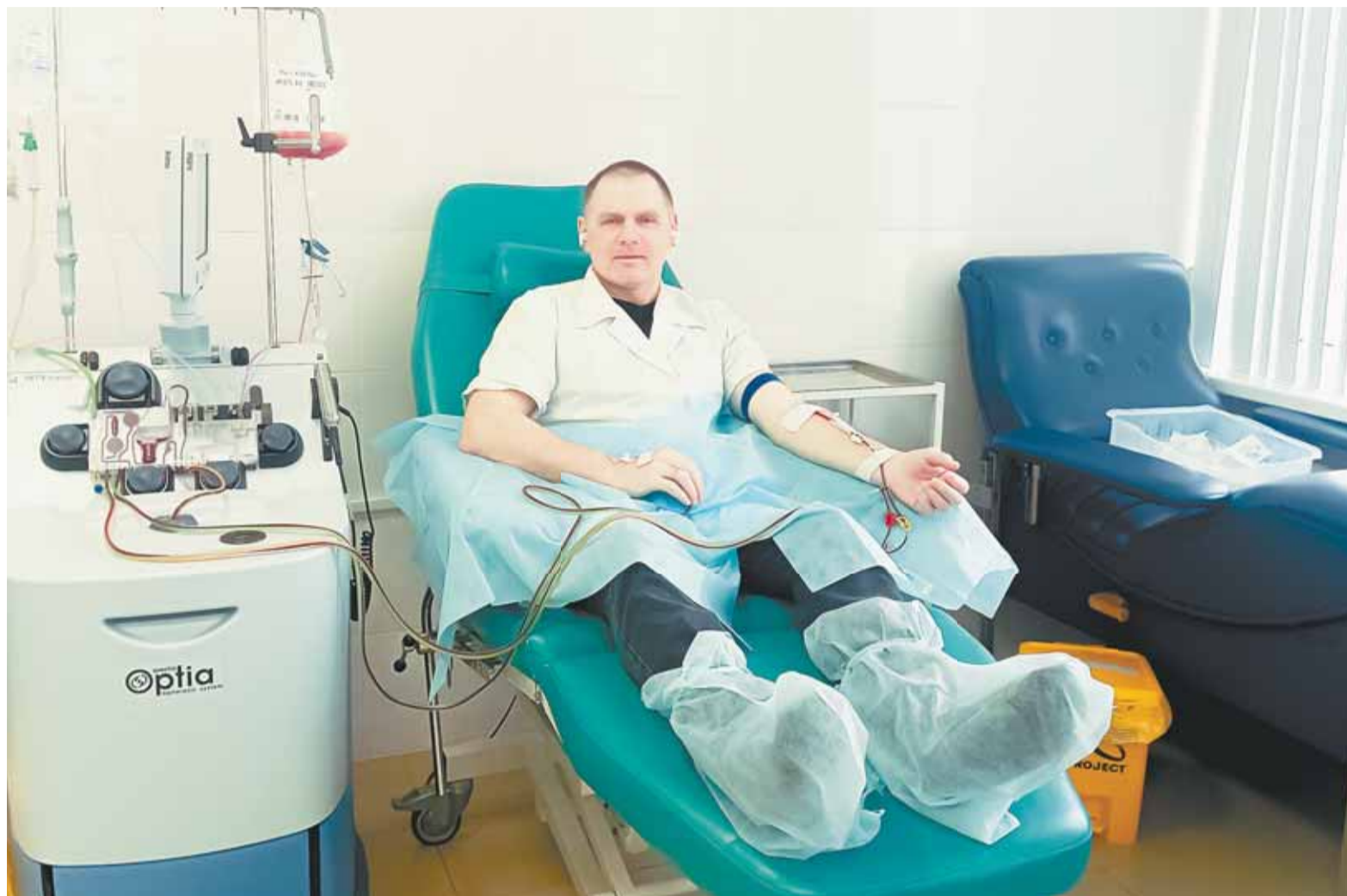
Процесс забора стволовых клеток занимает порядка пяти часов и напоминает собой обычную донацию.