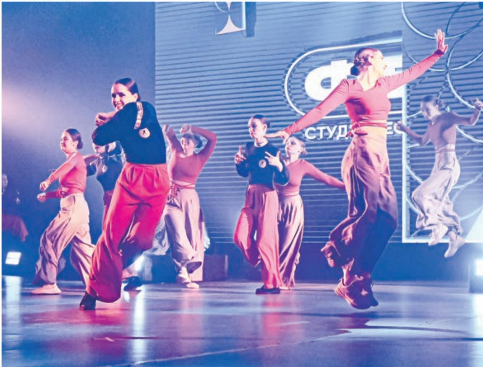
Самые яркие конкурсные выступления вошли в программу гала-концерта «Фесты».