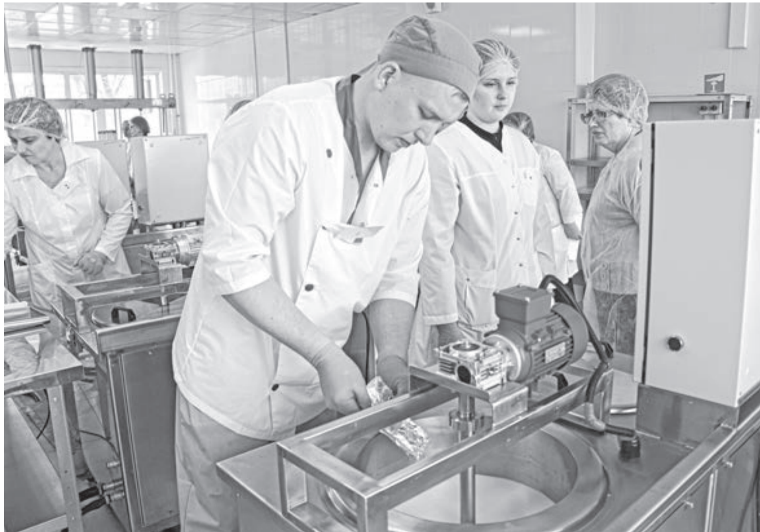
Секрет вкусного сыра кроется не только в качестве молока, но и в умелых руках мастера.

В преддверии практических испытаний – знание теоретических основ. Хитры и заковыристы ситуативные задачи, на которые нужно найти ответ участникам состязания. К примеру, что делать, если вдруг в момент варки сыра на производстве отключили