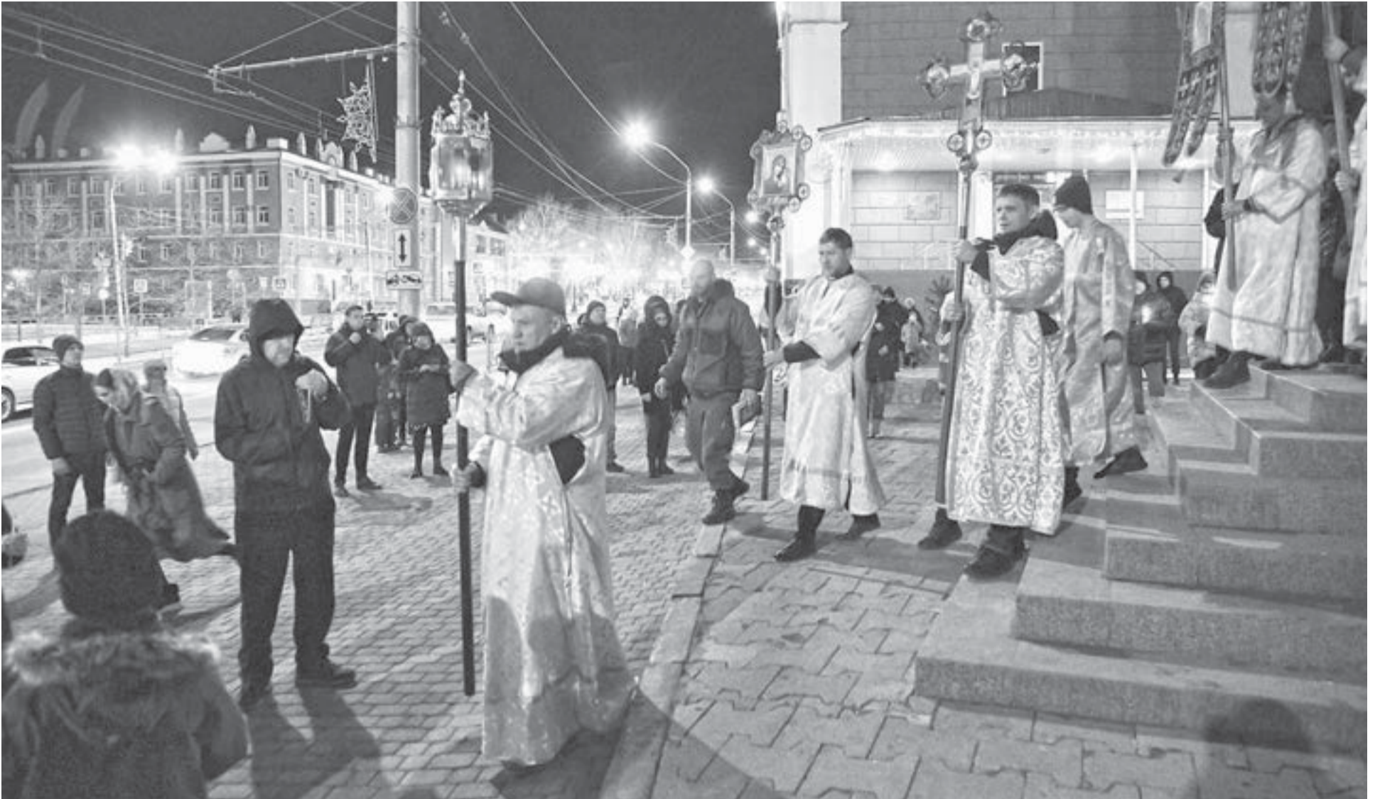
После ночной службы барнаульцы могут добраться домой на общественном транспорте.