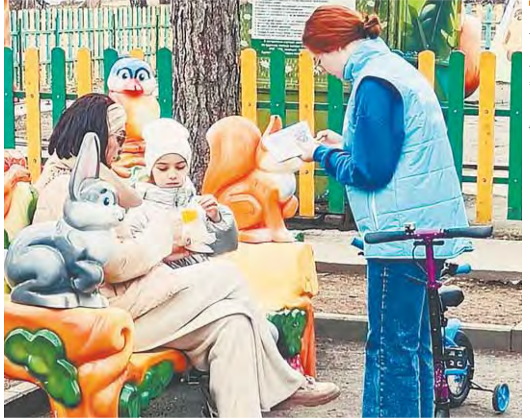
В Барнауле волонтеры рассказывают горожанам о том, как принять участие в онлайн-голосовании, и участвуют в экологических акциях на общественных территориях.

Кроме того, барнаульцы продолжают голосовать за дизайн-проект второго этапа обновления зеленой зоны, расположенной в границах улиц Антона Петрова, Ленинградская, Энтузиастов (территория бывшего парка имени