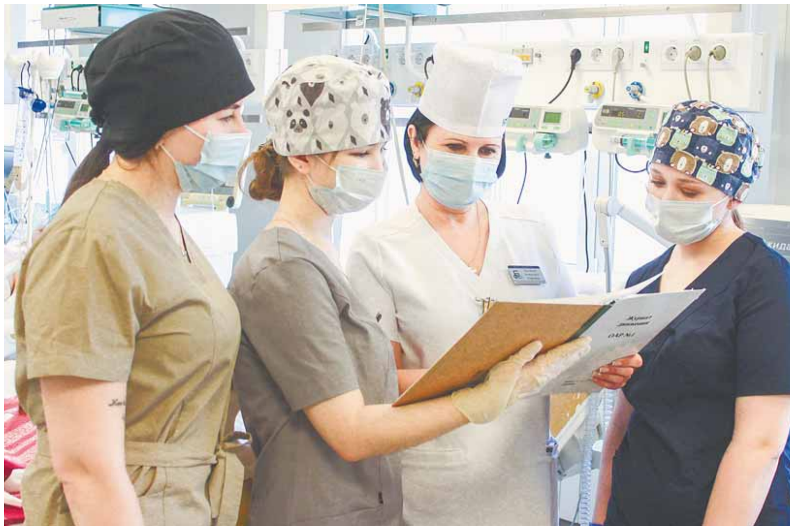
Для молодых специалистов БСМП-2 разработаны программы поддержки и профессионального погружения в профессию.