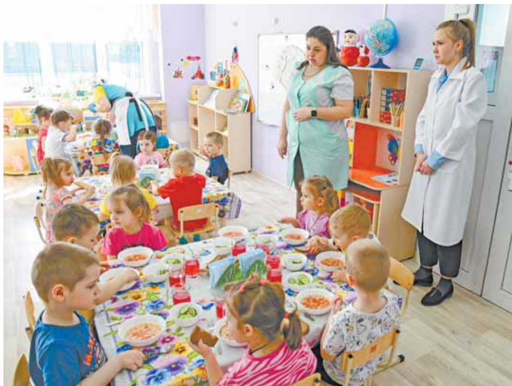
Во время обеда детей учат пользоваться столовыми приборами.