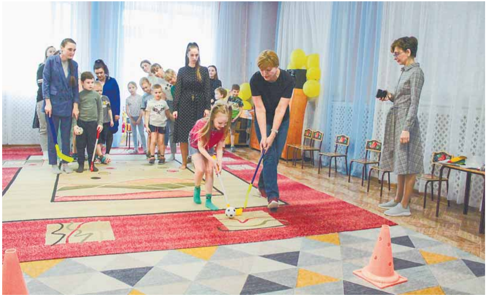
На встречи родительских клубов приглашают и детей.

консультационных пунктов работает на базе детских садов Барнаула.