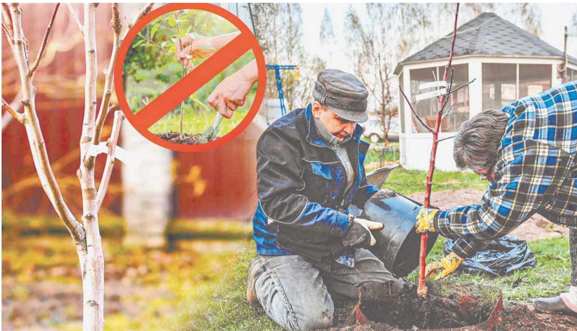
Коллаж Александра ЕРМОЛОВИЧА