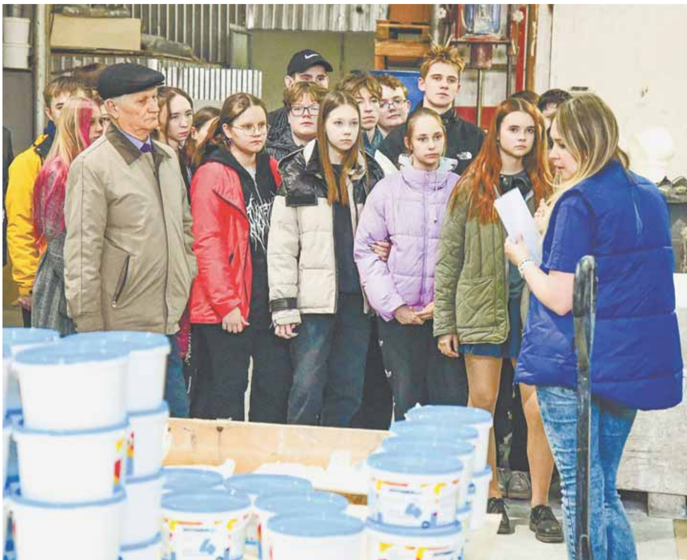
Учащиеся школы № 102 побывали на разных производственных участках завода.