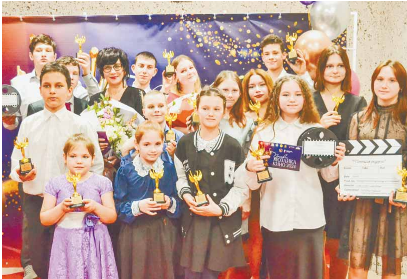
Памятные статуэтки получили все дети, также среди них определили лучших в своей новой профессии – актера, режиссера, оператора и других.