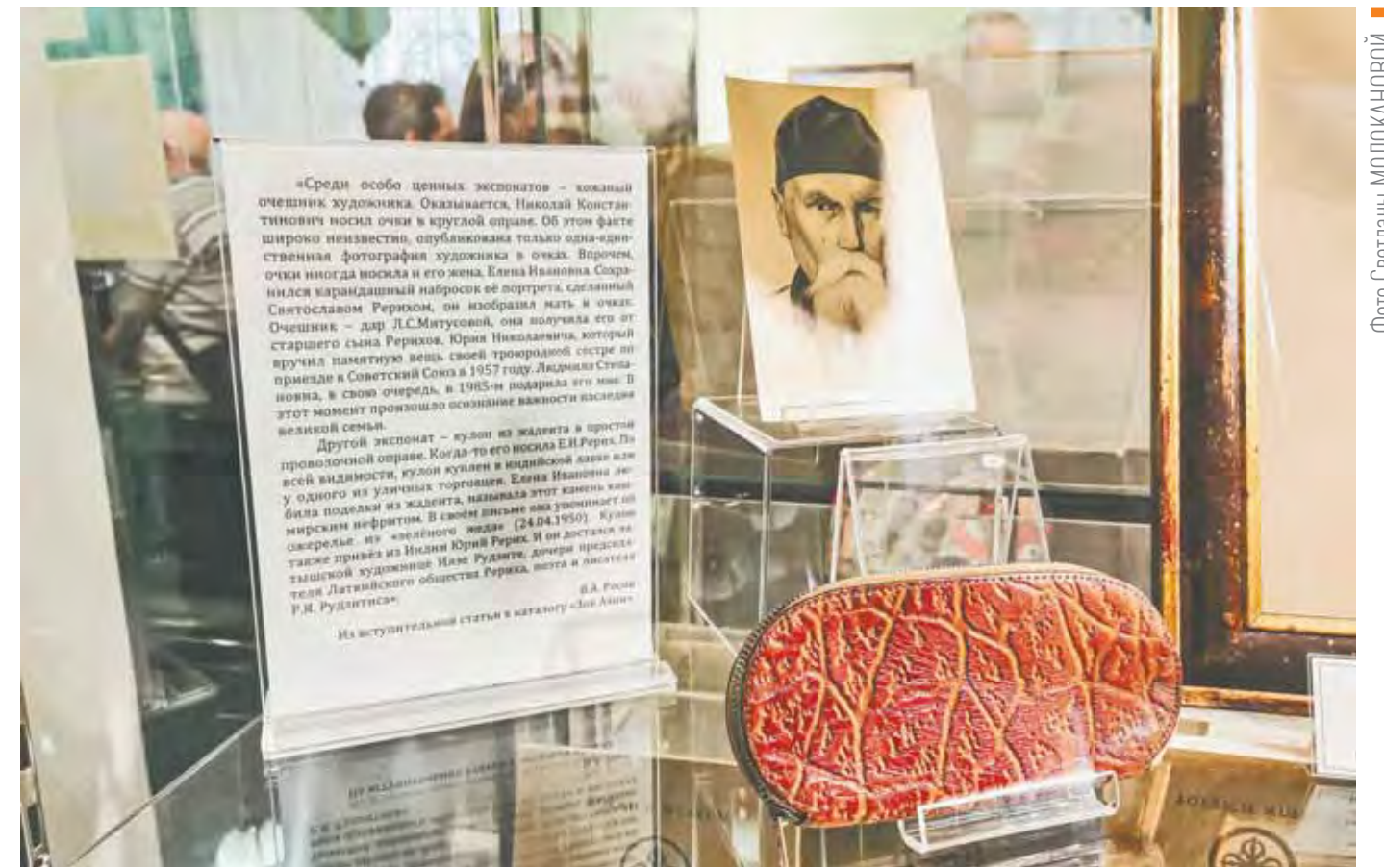
Очечник и другие экспонаты, связанные с Николаем Рерихом, можно увидеть на выставке «Зов Азии» до 16 июня.

В календаре юбилейных мероприятий по-особому отмечена еще одна дата — 3 июля, когда будет праздноваться десятилетие с момента вручения Алтайскому краю «Знамени Мира». В этот день в Барнауле, в сквере на ул. Приречной, планируется открыть арт-объект, посвященный 150-летию Николая Рериха.