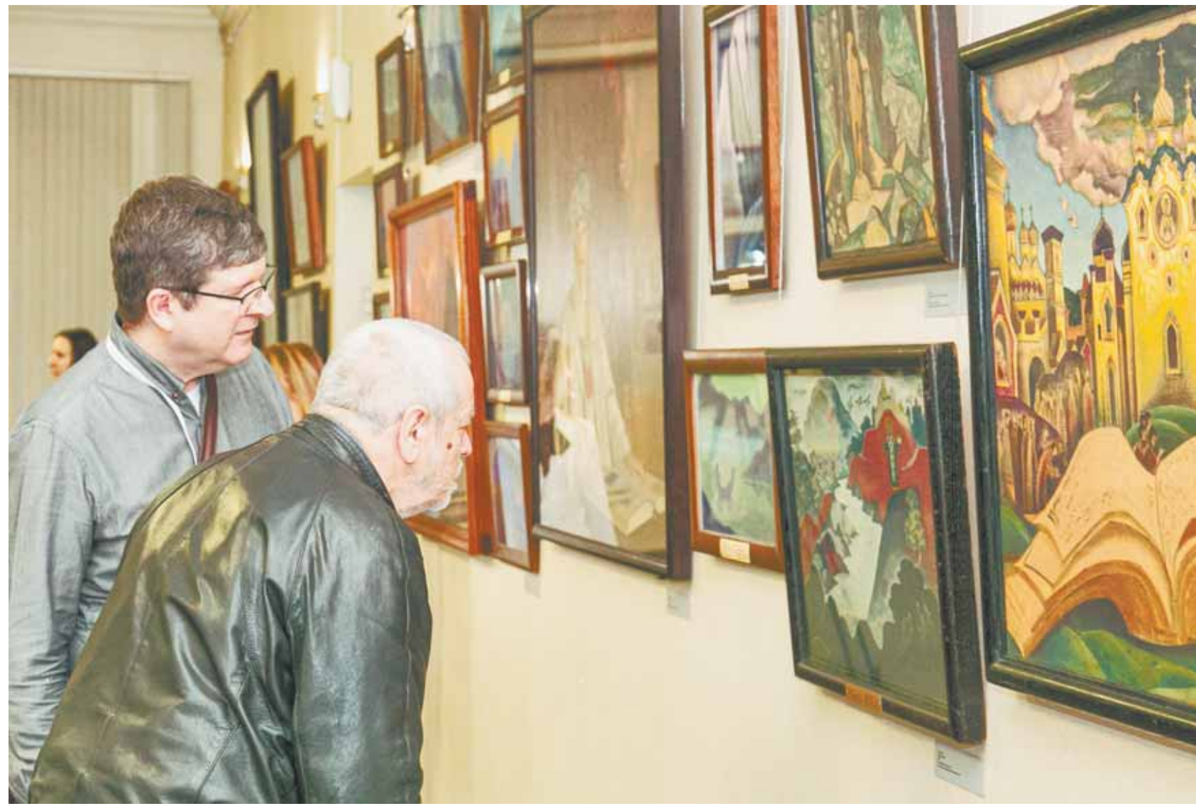
Уникальное наследие Николая и Святослава Рерихов из коллекции Музея Востока представлено впервые за Уралом.

Эта выставка значима еще и тем, что многие из представленных работ за пределами Москвы экспонируются впервые. Как считает директор Государственного музея Востока Александр Седов, несмотря на информационные таблички, эти картины не стоит анализировать умом, лучше всего их воспринимать с открытым сердцем. — «Ковчег будущего» — это часть большого выставочного проекта, который был подготовлен Музеем Востока и экспонировался на разных площадках Москвы, — пояснил Александр Всеволодович. — В Барнаул мы привезли 94 подлинных живописных полотна кисти Николая Рериха и его младшего сына Святослава. На двух этажах представлена не только пейзажная живопись, но и портреты, сюжетные работы. Они выставляются впервые за Уралом. Мировая премьера В этот же день на сцене Краевой филармонии состоялась мировая премьера концертной программы «Музыка русского мира», приуроченная к 150-летию Николая Рериха. По словам директора ГФЭК Елены Надточий, в ней музыканты попытались постараться на творчество Рериха через исторические события, их ретроспективу, а также через полотна художника и его философские постулаты. — В первой части программы рассказывается о Рерихе как о сценаристе и декораторе, — объяснила Елена