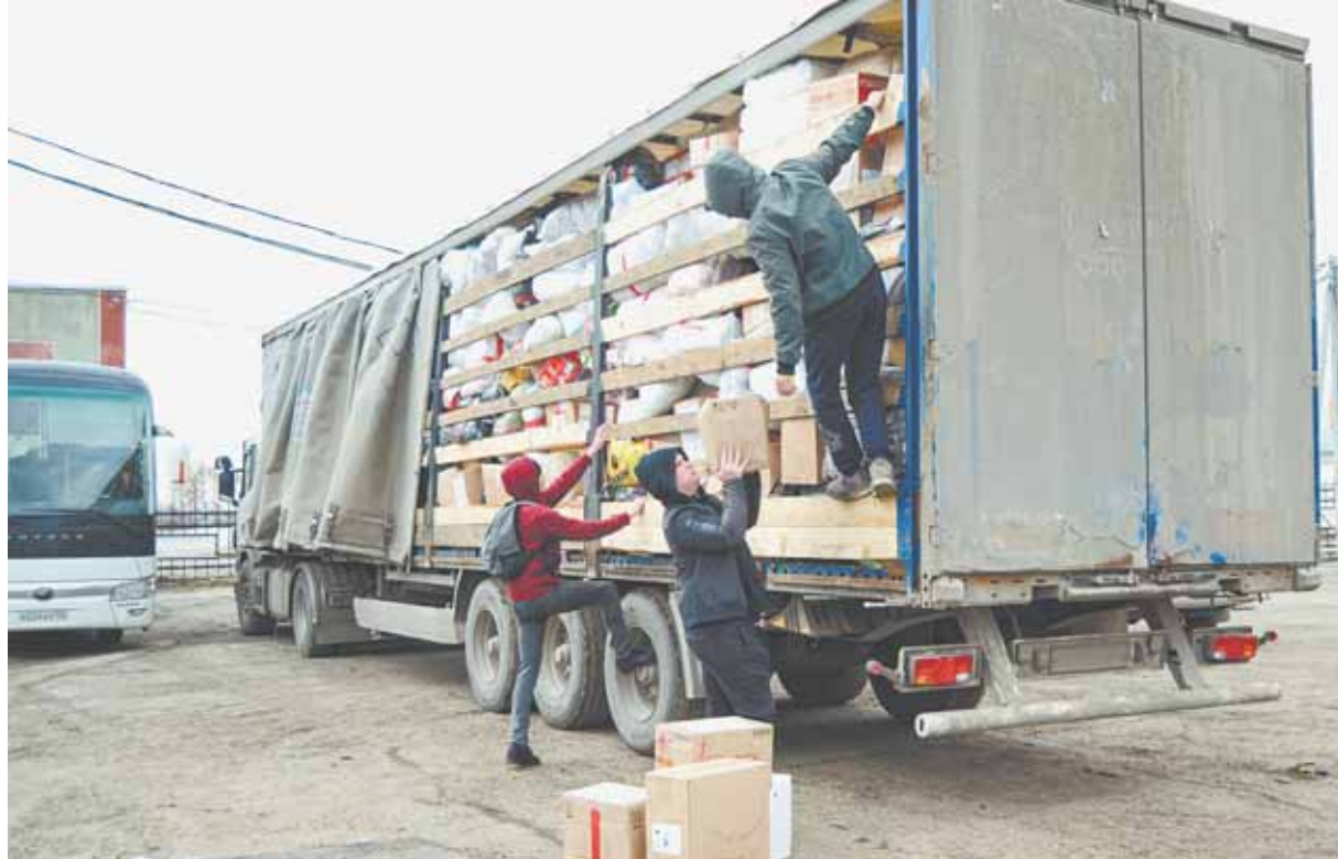
16 автомобилей и более 50 тонн груза общего назначения отправили в зону СВО из Барнаула.