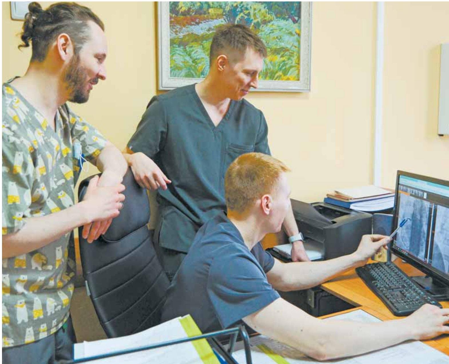
Идет обсуждение плана лечения очередного пациента.

– Отсекая все возможные причины кровотечения, мы понимали, что, скорее всего, у нашего пациента достаточно редкое заболевание дивертикул Меккеля – это выпячивание участка кишечника, которое наиболее подвержено развитию воспаления, кровотечения и заворота. Такое выпячивание встречается лишь