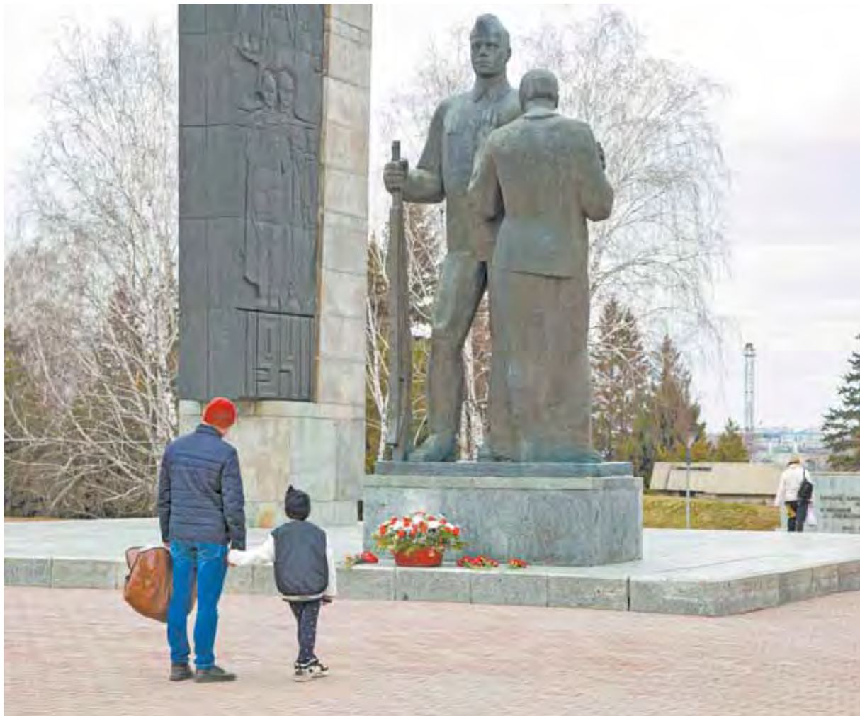
Забота о Мемориале Славы - дань уважения поколению победителей.