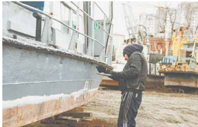
В подготовку к навигации вносят последние штрихи.