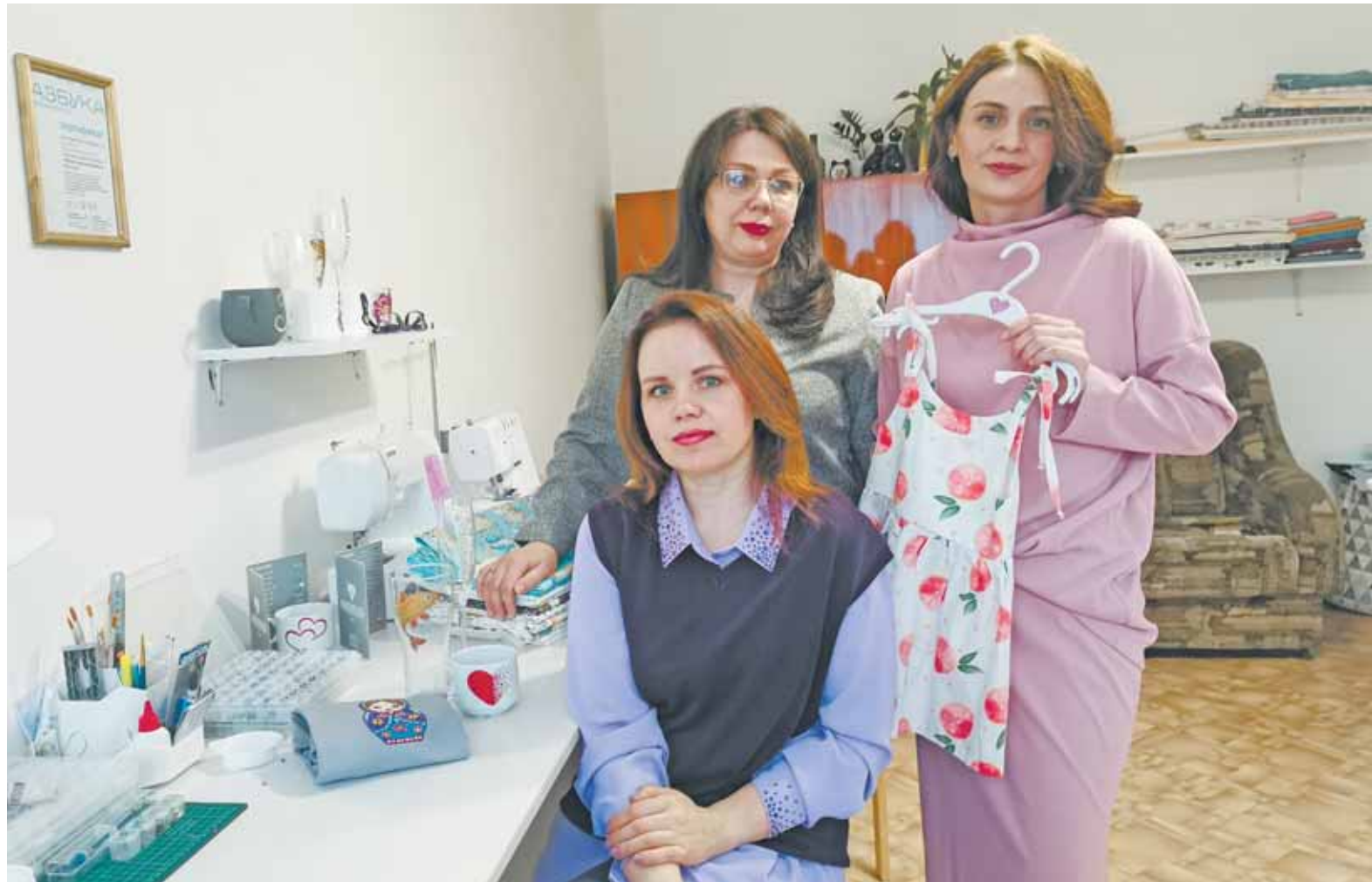
В месяц мастерская обрабатывает от 15 до 35 заказов.

– Идея открыть свое дело пришла мне во время декрета, причем сразу подумала о том, что нужно действовать сообща с сестрой. Вначале