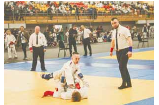
Все участники показали очень высокий уровень борьбы.