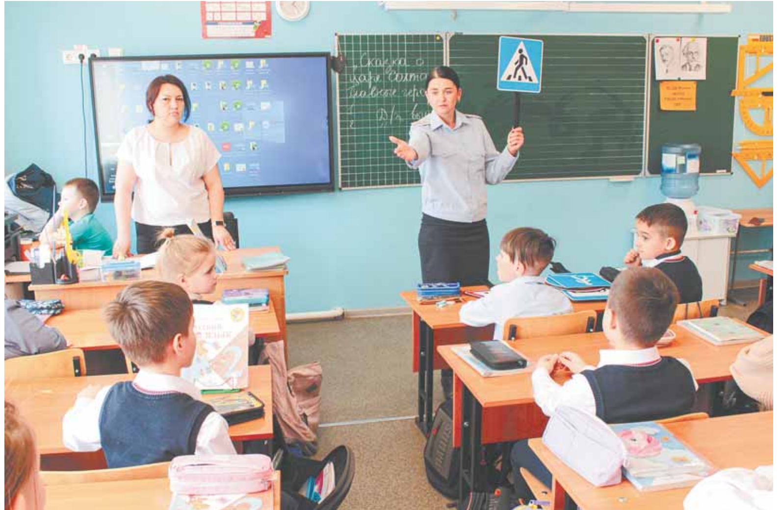
Безопасность детей на дорогах зависит от взрослых.

В преддверии летних каникул школьникам города напоминают правила передвижения на велосипедах и самокатах. Перед пешеходным переходом обязательно нужно спешиться и перейти проезжую часть, ведя средство индивидуальной мобильности рядом с собой.