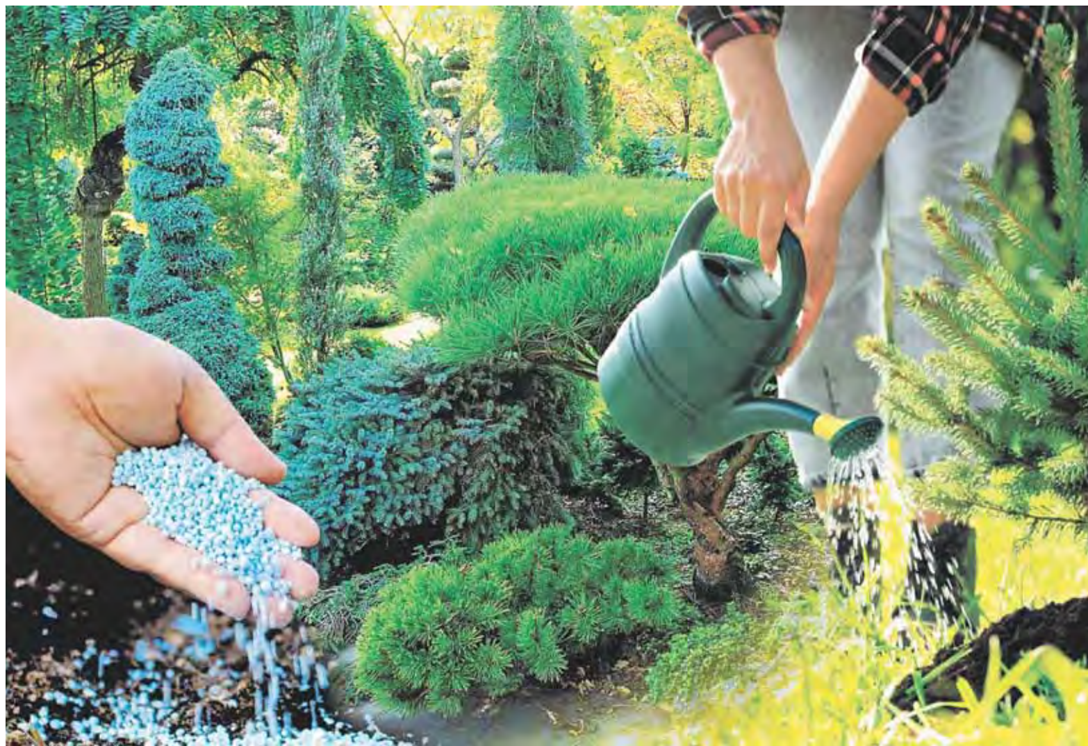
Коллаж Александра ЕРМОЛОВИЧА

Карликовые сорта любых хвойных лучше держать без подкормок, чтобы из-за активного роста они не потеряли свой миниатюрный размер. Опрыскивание проводится в безветренную и пасмурную погоду, чтобы капли воды на солнце не сработали, как линза, и на хвое не появился ожог.