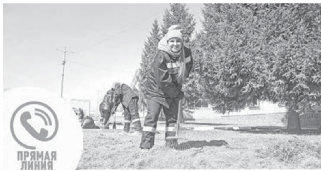
«Чистые четверги» охватывают зеленые зоны во всех районах города.

Ближайшие планы по каждому «чистому четвергу» публикуются на официальном интернет-сайте города. Дополнительно о планирующихся мероприятиях можно узнать в управлении коммунального хозяйства в администрации вашего района. Если вы, жители, организовались для проведения подобной акции на какой-либо территории общего пользования, в администрации района вам смогут помочь инвентарем и вывозом собранного