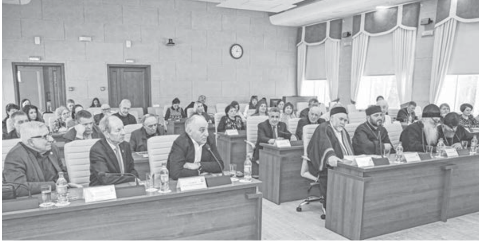
На территории Барнаула действуют 29 национально-культурных объединений.

В Железнодорожном районе на текущий год запланировано 15 мероприятий, некоторые из них уже состоялись. 26 февраля был организован праздник в честь открытия Года единства народов России, а 27 марта прошел фестиваль национальных культур «Венок дружбы». В его рамках выступили национальные творческие коллективы, а жители района представили на выставке «Декоративно-прикладное творчество народных ремесел» русские обереги и национальные костюмы.