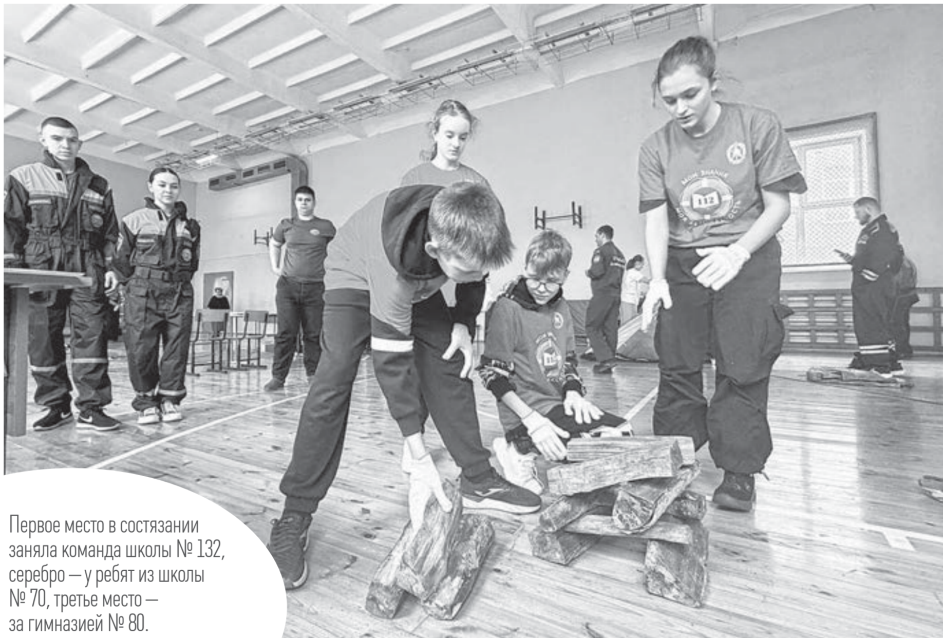
Участники команды гимназии № 69 показали, как правильно укладывать дрова для костра.

Барнаульские школьники продемонстрировали навыки поведения в экстремальных условиях