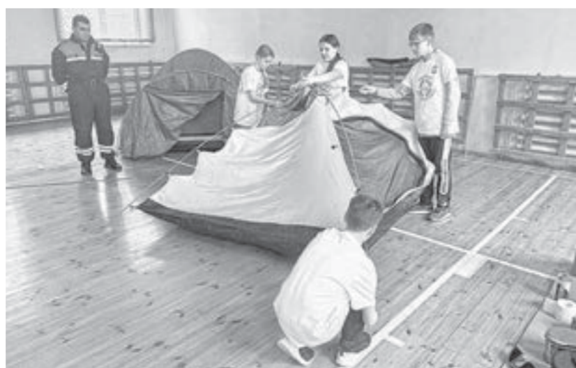
Один из этапов – на скорость собрать палатку.